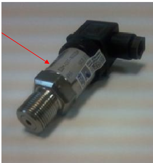
Рисунок 1 – Общий вид датчиков ДДМ-03Т-ДИ