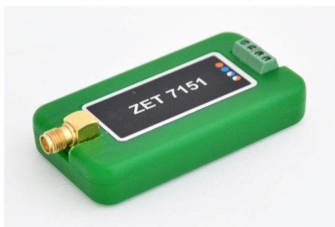
Рисунок 7 - Общий вид измерительного модуля в пластиковом корпусе

Схема пломбировки от несанкционированного доступа представлена на рисунке 8.