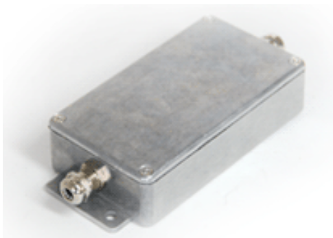
Рисунок 6 - Общий вид измерительного модуля в металлическом корпусе

Общий вид измерительных модулей ZET 7051 или ZET 7151 представлен на рисунке 6 и 7.