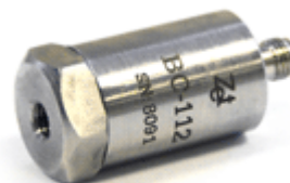
Рисунок 2 - Акселерометр BC 112