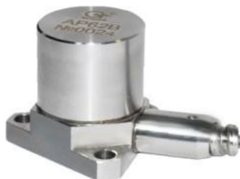
Рисунок 3 - Вибропреобразователь AP62B