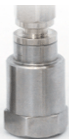
Рисунок 1 - Акселерометр BC 111

В акселерометрах BC 111 (рисунок 1) и BC 112 (рисунок 2) использован пьезочувствительный элемент в виде кольца с поляризацией по толщине. Съём заряда с пьезоэлемента акселерометра производится при помощи встроенного кабеля, который соединяет акселерометр с измерительным модулем.