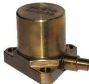
Рисунок 4 - Вибропреобразователь AP63B