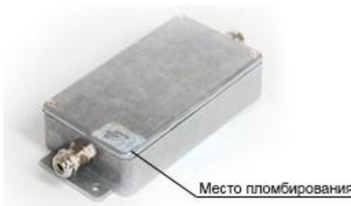
Рисунок 8 - Схема пломбировки от несанкционированного доступа

Схема пломбировки от несанкционированного доступа представлена на рисунке 8.