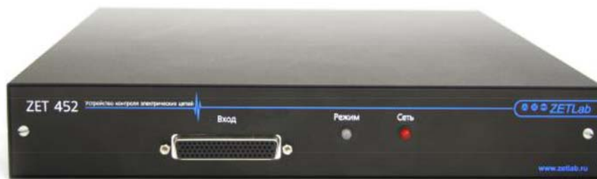
Рисунок 1 - Общий вид устройства ZET 452