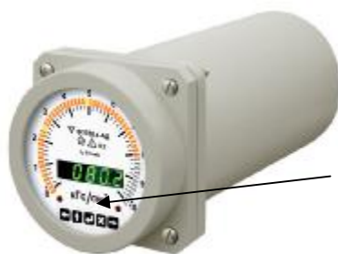
Рисунок 1 – Вид амперметров и вольтметров оптоэлектронных Ф1760 и Ф1760-АД.

Оттиск поверительного клейма, при положительных результатах поверки, наносят на стекло лицевой крышки прибора Ф1760.4-АД, у приборов других модификаций – на табличку, расположенную на верхней крышке.