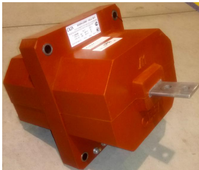
Рисунок 1 - Общий вид трансформаторов тока ТПОЛ-СВЭЛ-10