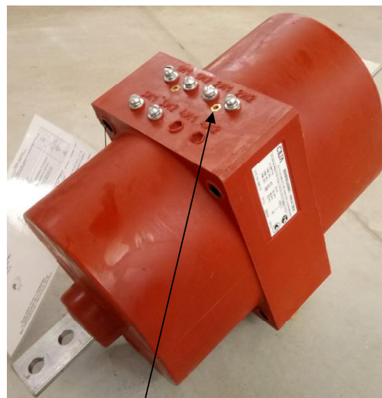
Рисунок 2 - Общий вид трансформаторов тока ТПОЛ-СВЭЛ-10М