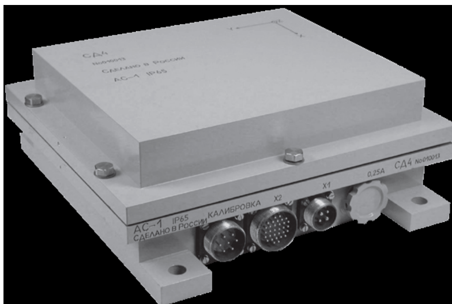
Рисунок 1 – Общий вид сейсмодатчика