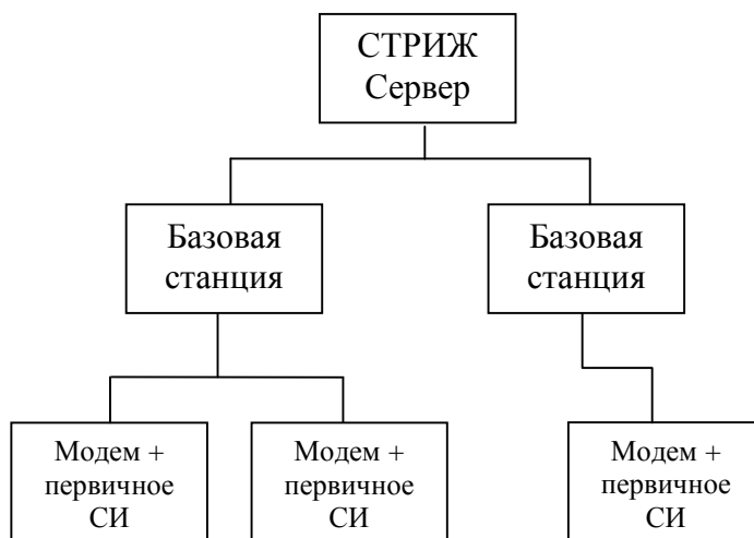
Рисунок 1. Структурная схема систем измерительных автоматизированных контроля и учета энергоресурсов «СТРИЖ Телематика»