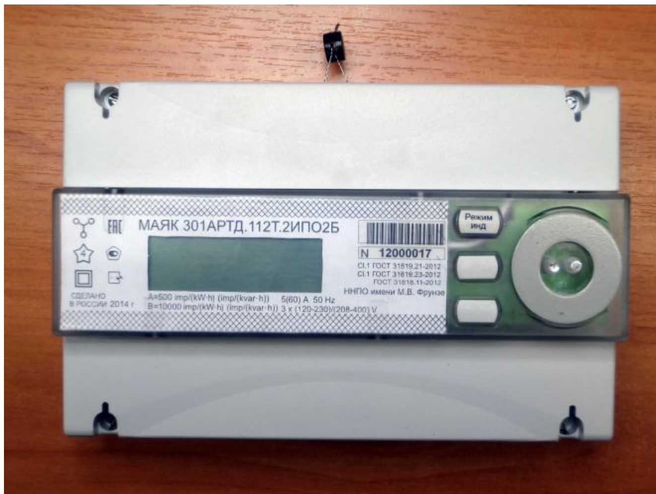
Рисунок 1 – Внешний вид счетчика с закрытыми крышками

Внешний вид счетчика МАЯК 301АРТД с закрытыми крышками приведен на рисунке 1.