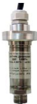
Рисунок 5 – ДД1