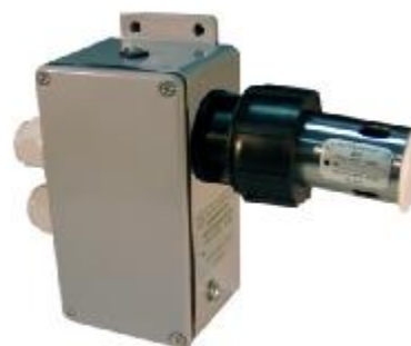
Рисунок 8 – ДЗО с КИ

Все датчики систем (ППП, ДД1, ДУТ, ДЗО) выдают измеряемые параметры в цифровом коде, что позволяет размещать их на расстоянии до 1200 м от устройства УР.