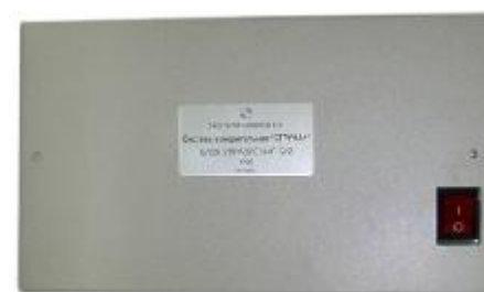
Рисунок 11 – БУ2