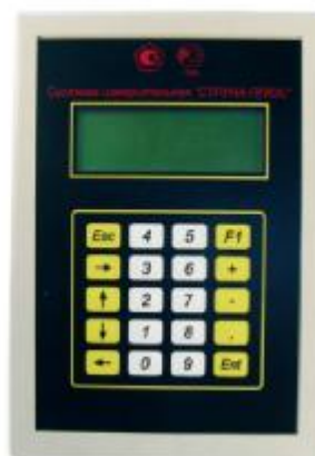
Рисунок 10 – БИ1