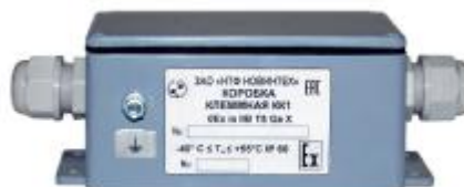
Рисунок 6 – КК1