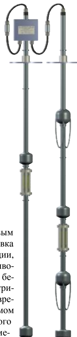
Рисунок 3 – ППП НБ

При взаимодействии кругового магнитного поля, вызванного токовым импульсом в проводнике-волноводе, и поля постоянных магнитов поплавок образует винтовое магнитное поле и, вследствие эффекта магнитострикции, формируется ультразвуковой импульс, который распространяется в противоположных направлениях по волноводу в виде крутильной волны. Волна, бегущая к верхней части ППП, преобразуется в приёмном устройстве в электрический сигнал и поглощается демпфирующим устройством. Промежуток времени между моментом генерации ультразвукового импульса и его приемом прямо пропорционален измеряемому расстоянию от поплавка до приёмного устройства. На основе измерений времени распространения ультразвука в металлическом проводнике-волноводе рассчитывается уровень продукта. Измеренное значение уровня преобразуется в цифровой код.