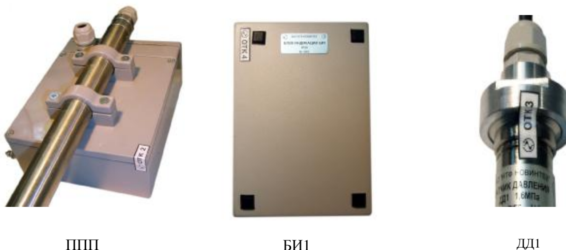
Рисунок 12 – Пломбирование составных частей систем

Места пломбирования составных частей систем (пломба ОТК) показаны на рисунке 12.