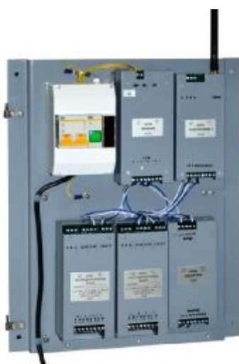
Рисунок 9 – УР

Блоки управления БУ2 (рисунок 11) предназначены для выдачи управляющих сигналов на световую и/или звуковую сигнализацию, а также на другие исполнительные устройства при достижении измеряемыми параметрами запрограммированных пороговых значений с целью предупреждения аварийных ситуаций, в том числе утечек продукта из резервуара.