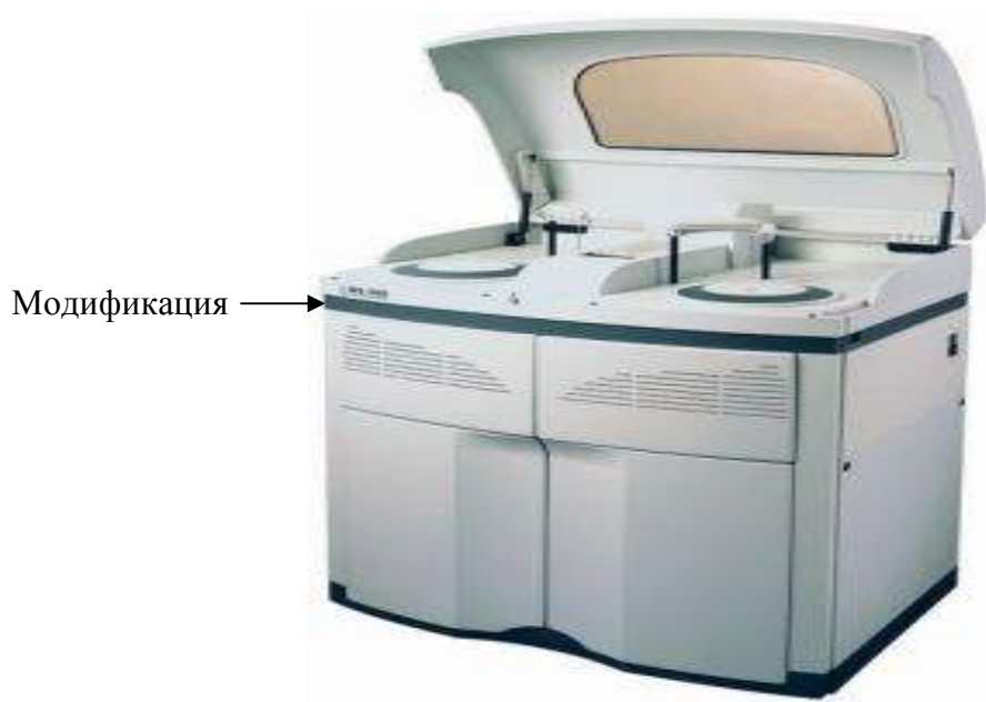
Рисунок 2 – Общий вид Анализатора автоматического биохимического «ACCENT 300»