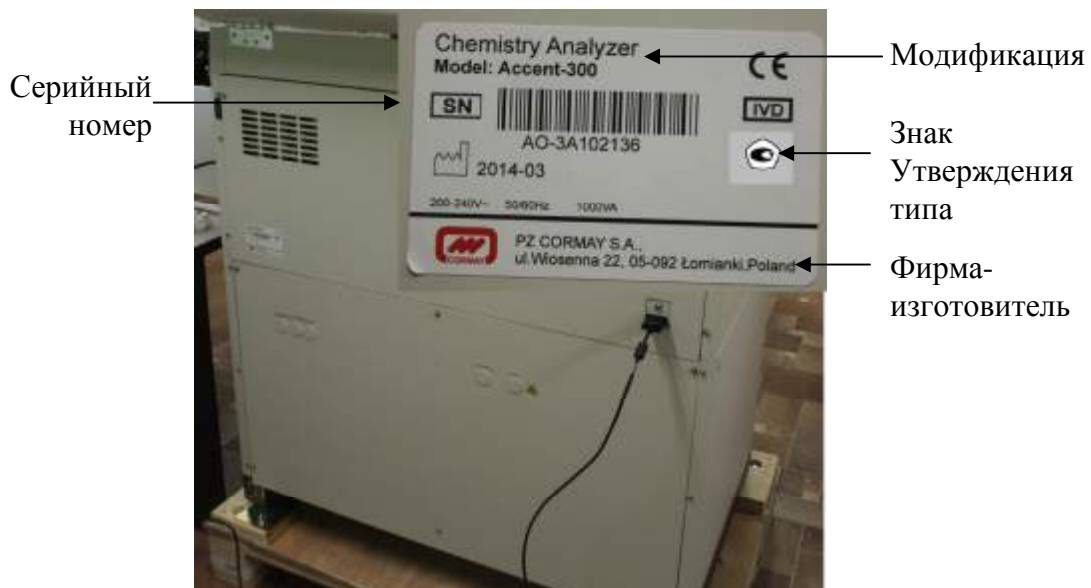
Рисунок 3 – Схема маркировки