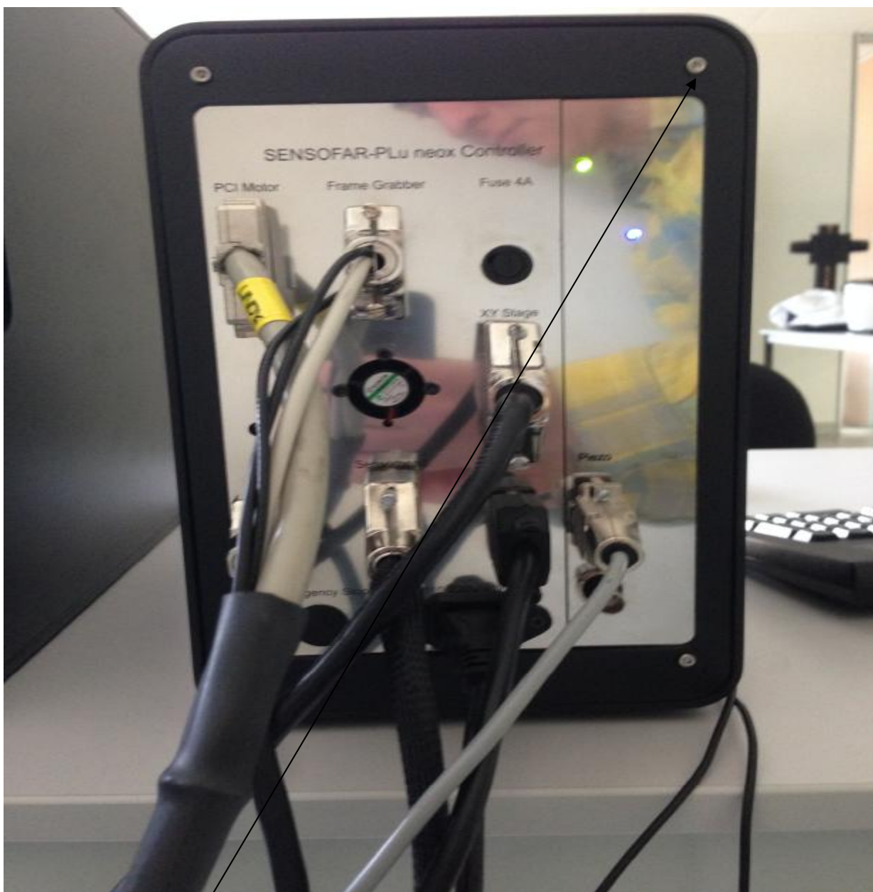
- место пломбировки от несанкционированного доступа Рисунок 2 – Общий вид профилометра Neox. Вид сзади.