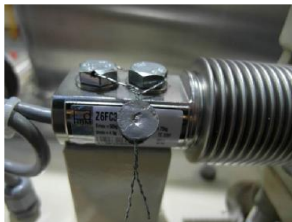
Рисунок 3.2 – Весоизмерительный датчик (свинцовая пломба)