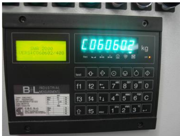
Рисунок 2- Внешний вид прибора SWA 2000 С

Принцип действия дозаторов основан на преобразовании деформации упругих элементов тензорезисторных датчиков, возникающей под действием силы тяжести дозируемого материала, в аналоговый электрический сигнал, изменяющийся пропорционально массе дозируемого материала. Далее аналоговый электрический сигнал с датчиков поступает на весоизмерительный прибор, в котором сигнал обрабатывается, и информация о массе дозируемого материала индицируется на цифровом табло.