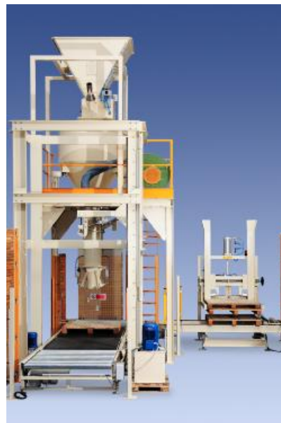
Рисунок 1.1 – Модификация с НПД до 60 кг