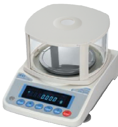
Рисунок 1 – Общий вид весов DX

Общий вид весов представлен на рисунке 1.