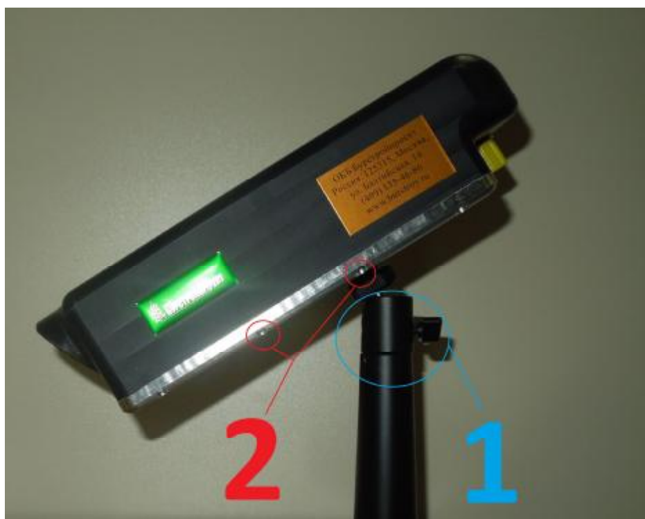
Рис. 2 Датчик состояния поверхности дорожного полотна «ДСПД» 1-кронштейн, 2-пломбы (залитые винты)