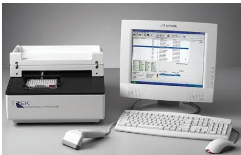
Рисунок 1. Внешний вид Модуля Sensititre AutoReader

Модуль для автоматического считывания панелей Sensititre AutoReader предназначен для измерения интенсивности флуоресценции при проведении бактериологического анализа биологических проб. Внешний вид модуля представлен на рисунке 1.