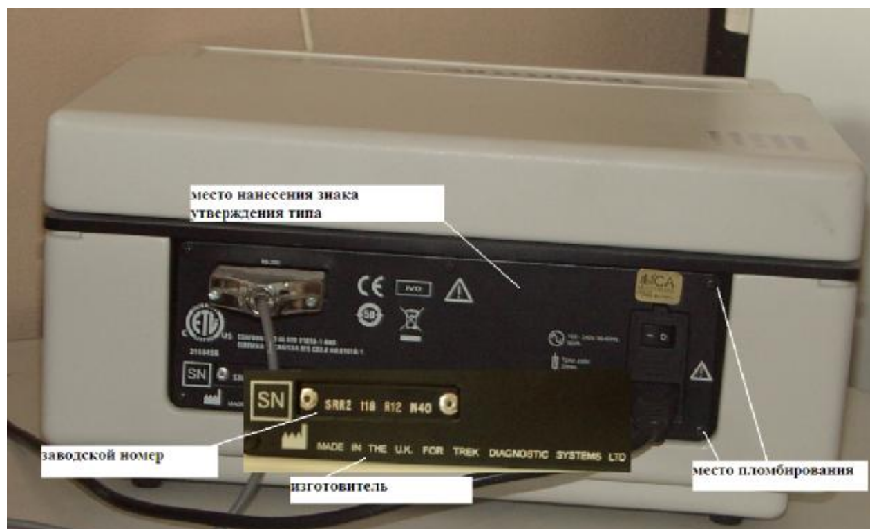
Рисунок 6 – Схема маркировки и пломбировки (для Модуля Sensititre AutoReader)