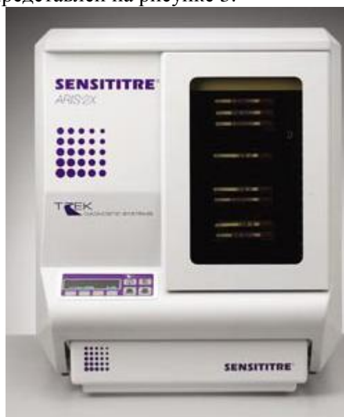
Рисунок 3. Внешний вид Модуля Sensititre ARIS 2X

Внешний вид модуля представлен на рисунке 3.