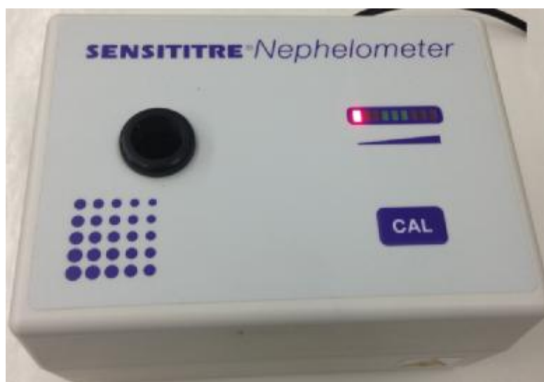
Рисунок 5. Внешний вид Модуля Sensititre Nephelometer

Внешний вид модуля представлен на рисунке 5.