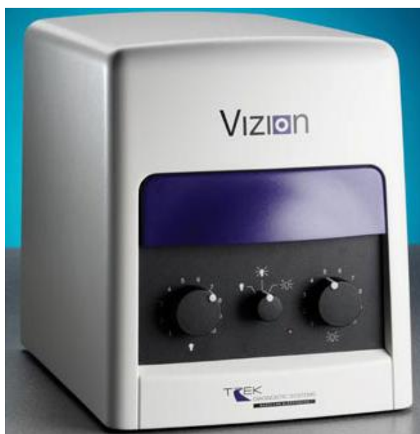
Рисунок 4. Внешний вид Модуля Sensititre Vizion

Внешний вид модуля представлен на рисунке 4.