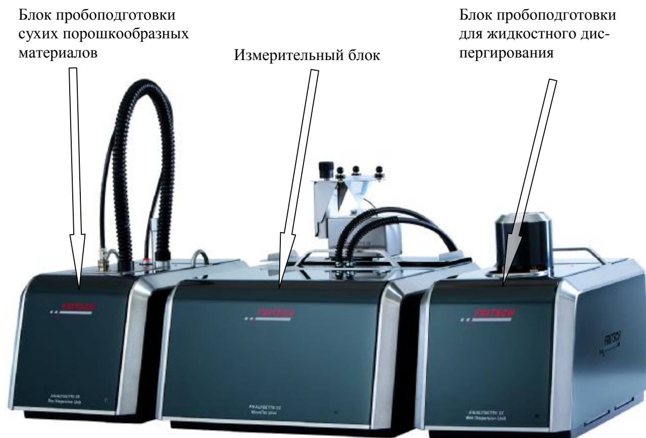
Рисунок 1 – Внешний вид анализатора, обозначение места для размещения знака утверждения типа