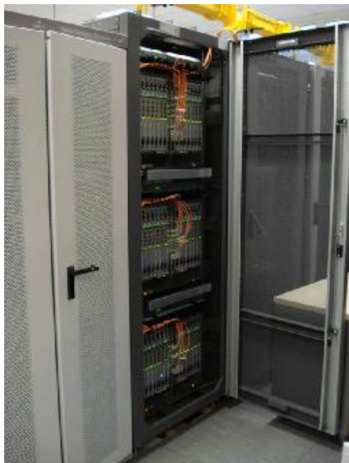
Рисунок 1- Общий вид оборудования с открытой дверью

Общий вид оборудования и место блокирования от несанкционированного доступа, представлены на рисунках 1 и 2.