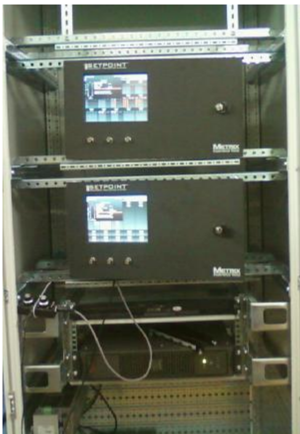
Рисунок 1 – Внешний вид системы мониторинга и диагностики стационарной ССМД

Внешний вид системы мониторинга и диагностики стационарной ССМД приведен на рисунке 1, структурная схема системы мониторинга и диагностики стационарной ССМД приведена на рисунке 2.