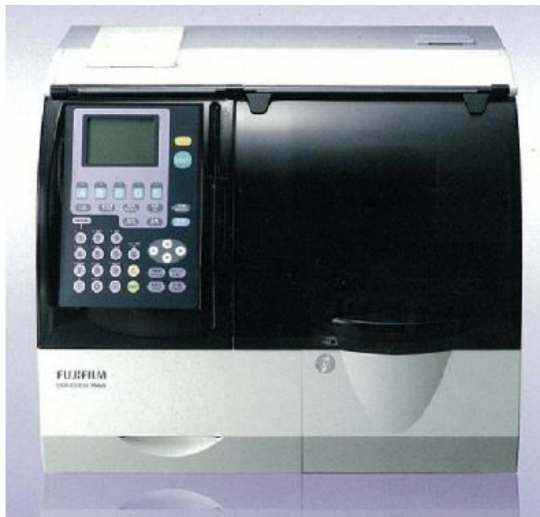
Рисунок 2 – Общий вид анализаторов модель FUJI DRI-CHEM 7000i.