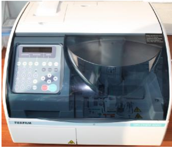
Рисунок 1 – Общий вид анализаторов модель FUJI DRI-CHEM 4000iе.