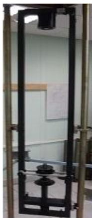
Рисунок 1 – Общий вид комплекта видеосветового оборудования для контроля внутренней геометрии (КВО КВГ)

Управление шаговым двигателем осуществляется посредством СОМ-порта компьютера и кабеля. При срабатывании концевых выключателей происходит остановка шагового двигателя. В поле зрения видеодатчика находятся визирные марки, установленные в видеоконтрольном устройстве.