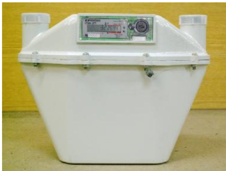
Рисунок 1. Внешний вид счетчика газа