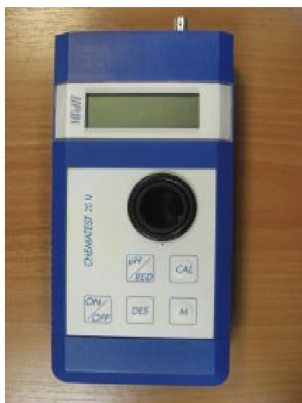
Рис. 1. Анализаторы Chematest. Вид спереди.