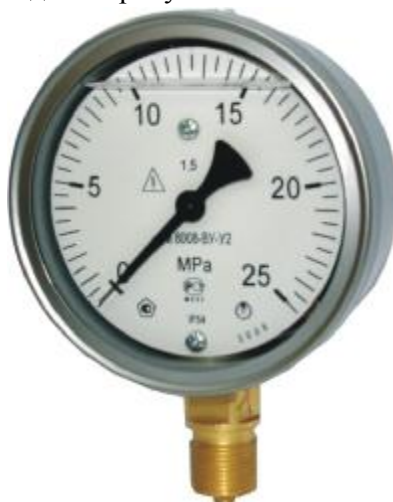
Рисунок 1 - Общий вид прибора

Общий вид прибора приведен на рисунке 1.