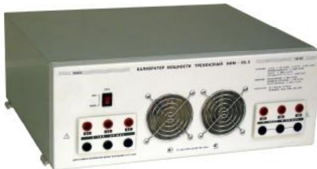
Рисунок 1. Калибратор мощности трехфазный КФМ-06.3. Общий вид

Фотография общего вида и место пломбирования калибратора представлены на рисунках 1 и 2.