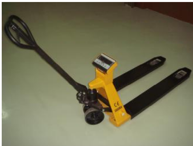
Рисунок 1 Общий вид весов электронных ЕВ4-РТ

И – вариант исполнения дисплея индикатора (Е – светодиодный; С – жидкокристаллический).