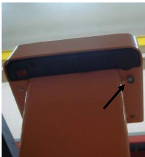
Рисунок 3 Схема пломбировки от несанкционированного доступа и обозначение места для нанесения отпечатка клея.

В весах предусмотрена защита от несанкционированного изменения установленных регулировок (установленных параметров и регулировки чувствительности (юстировки)) при помощи перемычки, расположенной внутри корпуса весов. После поверки весы пломбируются поверителем пломбой, закрывающей доступ внутрь корпуса весов (рисунок 3).