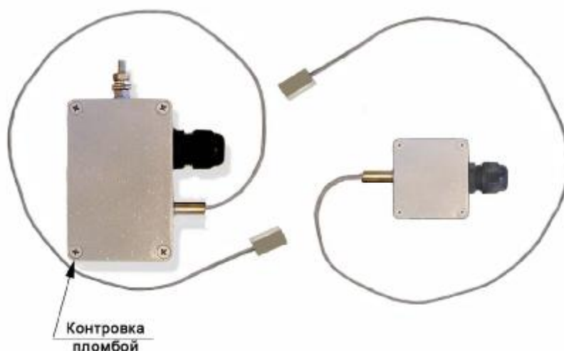
Рис.6 Поверхностные общепромышленные преобразователи ТХА 002.П-Оп, ТХК 002.П-Оп и поверхностные преобразователи ТХА 002.П-Ехi, ТХК 002.П-Ехi с видом взрывозащиты «Искробезопасная электрическая цепь» по ТР ТС 012/2011