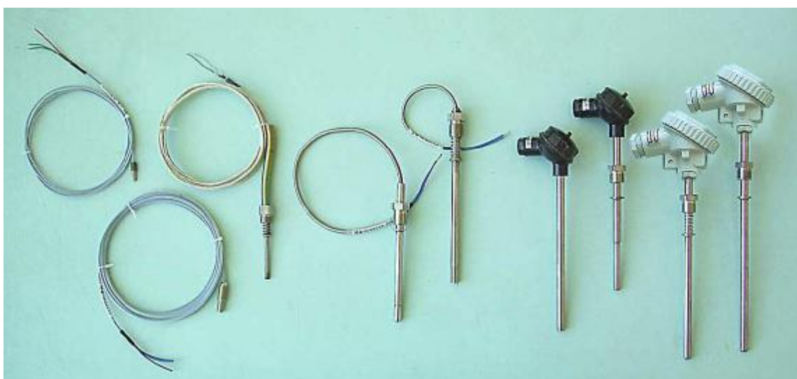
Рис.3 Погружаемые общепромышленные преобразователи ТХА 002-Op, ТХК 002-Op и погружаемые преобразователи ТХА 002-Exi, ТХК 002-Exi с видом взрывозащиты «Искробезопасная электрическая цепь» по ТР ТС 012/2011 с диаметром защитной арматуры до 10 мм включительно