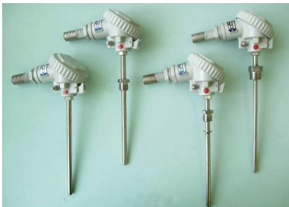
Рис.5 Взрывозащищенные погружаемые преобразователи ТХА 002-Ехd, ТХК 002-Ехd с видом взрывозащиты «Взрывонепроницаемая оболочка» по ТР ТС 012/2011