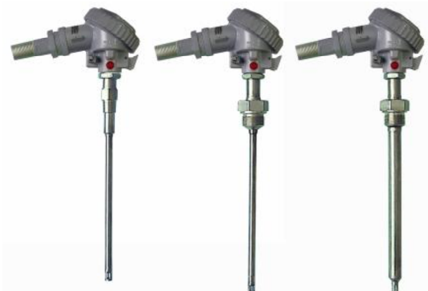
Рис.2 Взрывозащищенные преобразователи ТХА 001-Exd с видом взрывозащиты «Взрывонепроницаемая оболочка» по ТР ТС 012/2011