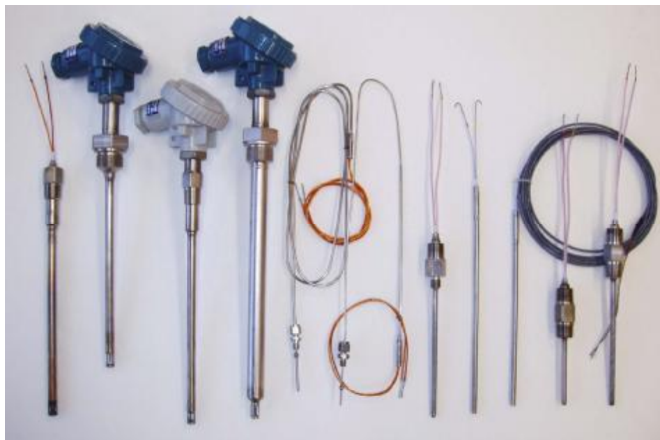
Рис.1 Общепромышленные преобразователи ТХА 001-Оп и преобразователи ТХА 001-Ехi с видом взрывозащиты «Искробезопасная электрическая цепь» по ТР ТС 012/2011

Фотографии общего вида преобразователей представлены на рисунках 1-7.