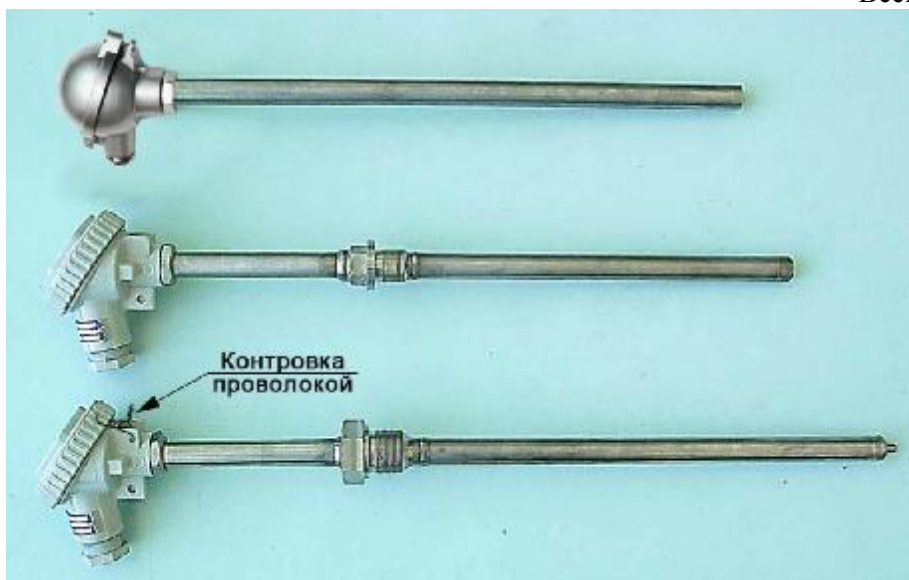
Рис.4 Погружаемые общепромышленные преобразователи ТХА 002-Оп, ТХК 002-Оп и погружаемые преобразователи ТХА 002-Ехi, ТХК 002-Ехi с видом взрывозащиты «Искробезопасная электрическая цепь» по ТР ТС 012/2011 с диаметром защитной арматуры 20 мм