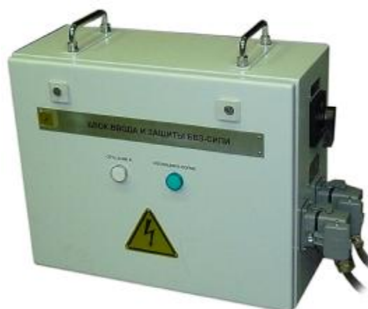
б) блока ввода и защиты БВЗ-СИПИ