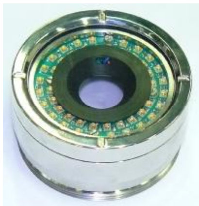
а) насадка прямого обзора