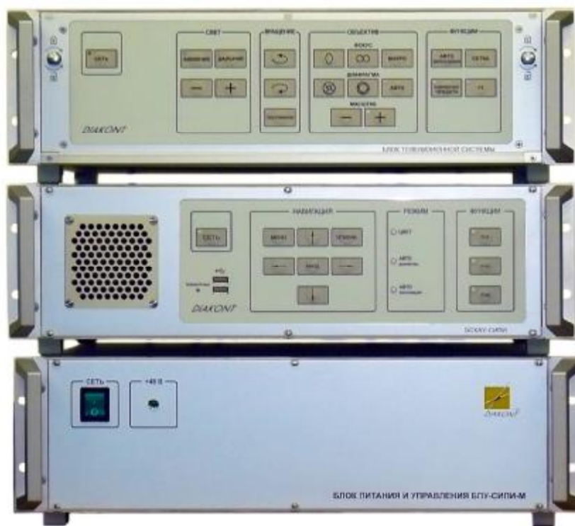
Рисунок 4 – Внешний вид БТС А-40 А, БСКАУ-СИПИ, БПУ-СИПИ-М