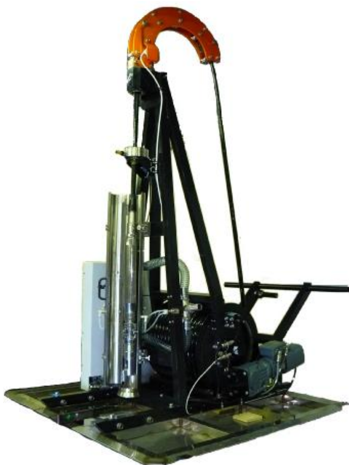
а) УЗ-СИПИ-М с зондом