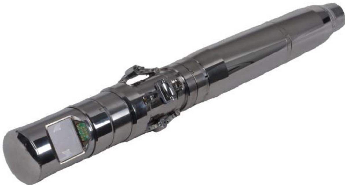
Рисунок 1 – Внешний вид зонда с боковой насадкой

Образец испытательный ИГК-85.00.00 представляет собой конструкцию, состоящую из корпуса, тест-образца и фланца. На тест-образец нанесены имитаторы дефектов. На фланец, а также на тест-образец нанесены риски, определяющие начало отсчета углового положения имитатора дефекта. Внешний вид тест-образца представлен на рисунке 6.