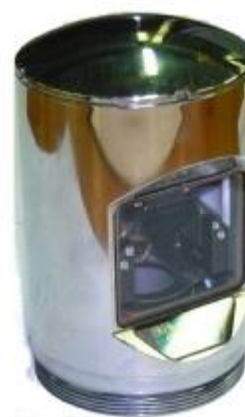
б) насадка бокового обзора