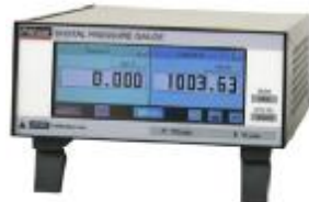
Рис. 2. Калибратор давления CPG2500