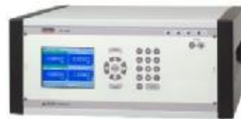
Рис. 3. Калибратор давления CPG8000