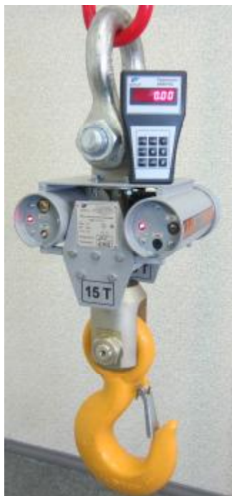
Рисунок 1 – Фотография общего вида весов электронных крановых ВКМ ХТ