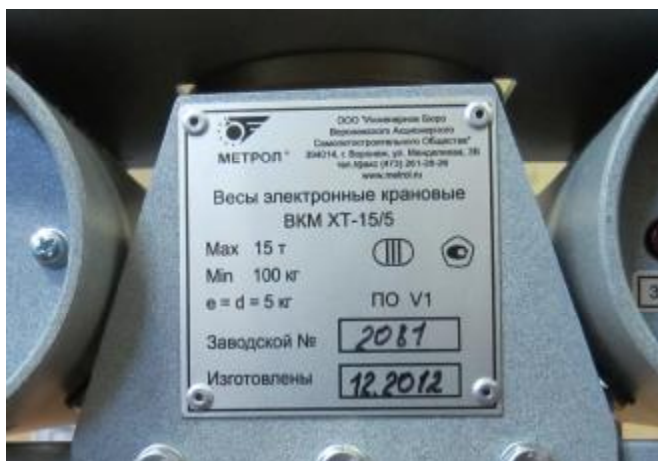
Рисунок 2 – Маркировка весов электронных крановых ВКМ ХТ

Маркировка весов производится на разрушаемой при снятии фирменной пластине, закрепленной на боковой плите корпуса весов, на которой нанесено: