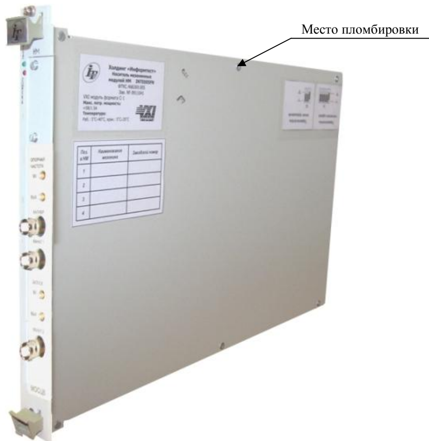
Рисунок 4 – Внешний вид носителя мезонинных модулей НМ-С (НМ, НМУ) с установленным осциллографом