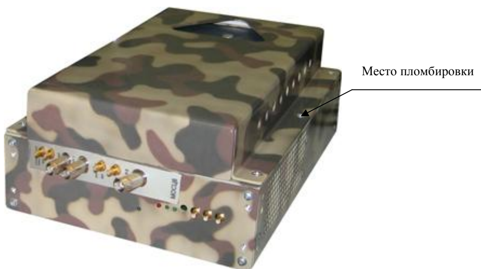
Рисунок 3 – Внешний вид устройства MezaBox\Battery 133W-hrs с установленным осциллографом