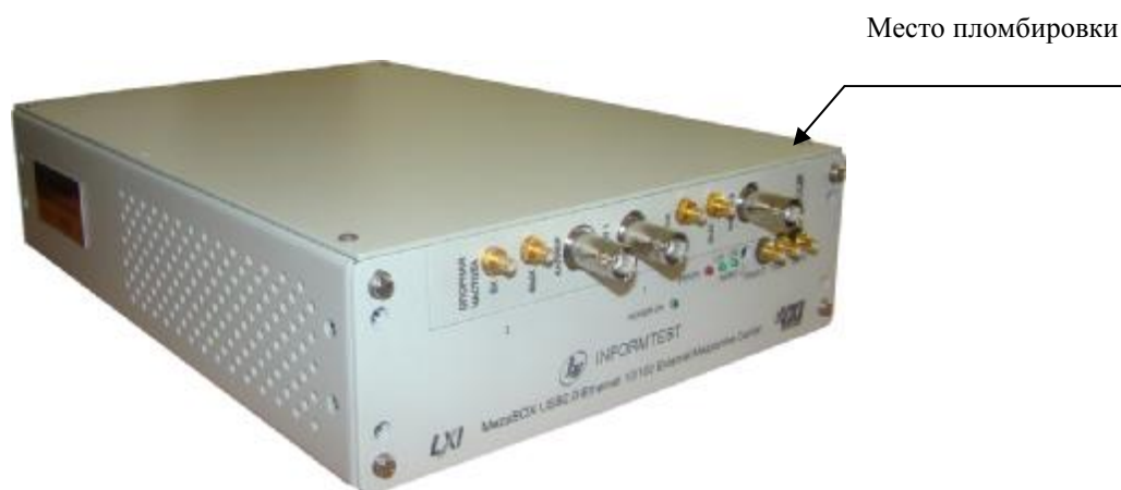
Рисунок 2 – Внешний вид устройства MezaBox с установленным осциллографом