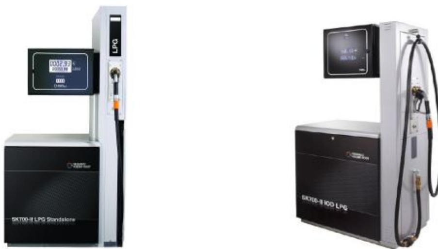
Р и с у н о к 1 – Колонки раздаточные сжиженного газа: а) SK700-2/LPG, б) SK700-2/IOD/LPG.

Исполнение SK700-2/LPG от SK700-2/IOD/LPG отличается расположением рукава раздаточного и электронного блока.