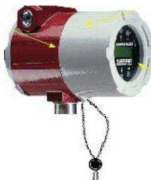
Рисунок 2 - Место пломбирования

На рисунке 2 показан способ пломбирования.