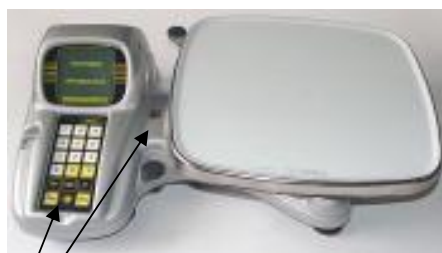
Место пломбировки весов ВЭУ-ХС-Z-(И)-А