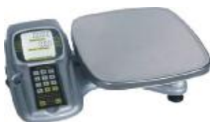
Весы торговые ВЭУ-ХС-Z-(И)-А