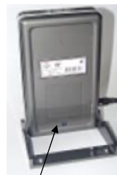
Место пломбировки весов: ВЭУ-Х-Z-A-Д; ВЭУ- Х-Z-Д; ВЭУ- Х-Z-A-Д-У