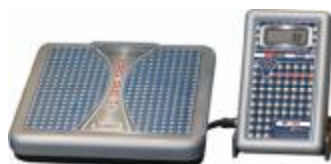
Весы напольные с автономным питанием ВЭУ-Х-Z-A-Д