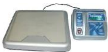
Весы напольные фасовочные ВЭУ-Х-Z-Д