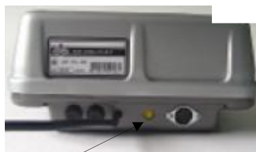
Место пломбировки весов ВЭУ- ХС-Z-(И)-СТ-Д-У