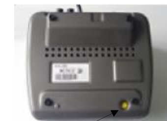
Место пломбировки весов ВЭУ-ХС-Z-Д-У