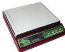
Весы фасовочные ВЭУ-Х-Z-A