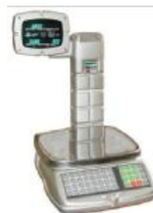
Весы с печатью этикеток ВЭУ-ХС-Z-И-П-СТ