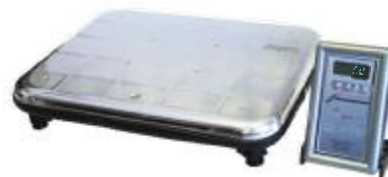
Весы напольные с увеличенной платформой ВЭУ-Х-Z-A-Д-У