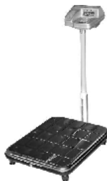
Весы напольные с термина- лом управления на стойке ВЭУ- ХС-Z-(И)-СТ-Д-У