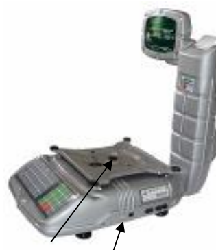
Место пломбировки весов ВЭУ-ХС-Z-И-П-СТ