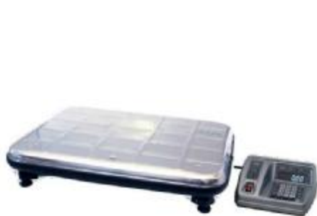
Весы напольные ВЭУ-ХС-Z-Д-У