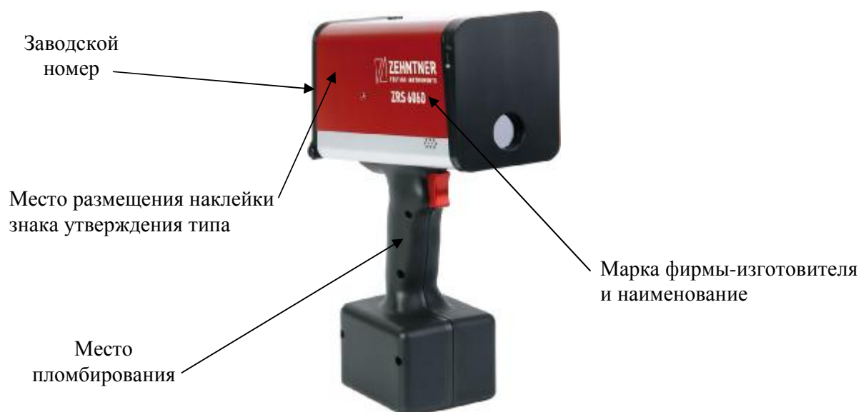
Рисунок 4 – Ретрорефлектометр ZRS 6060, обозначение мест маркировки и пломбирования