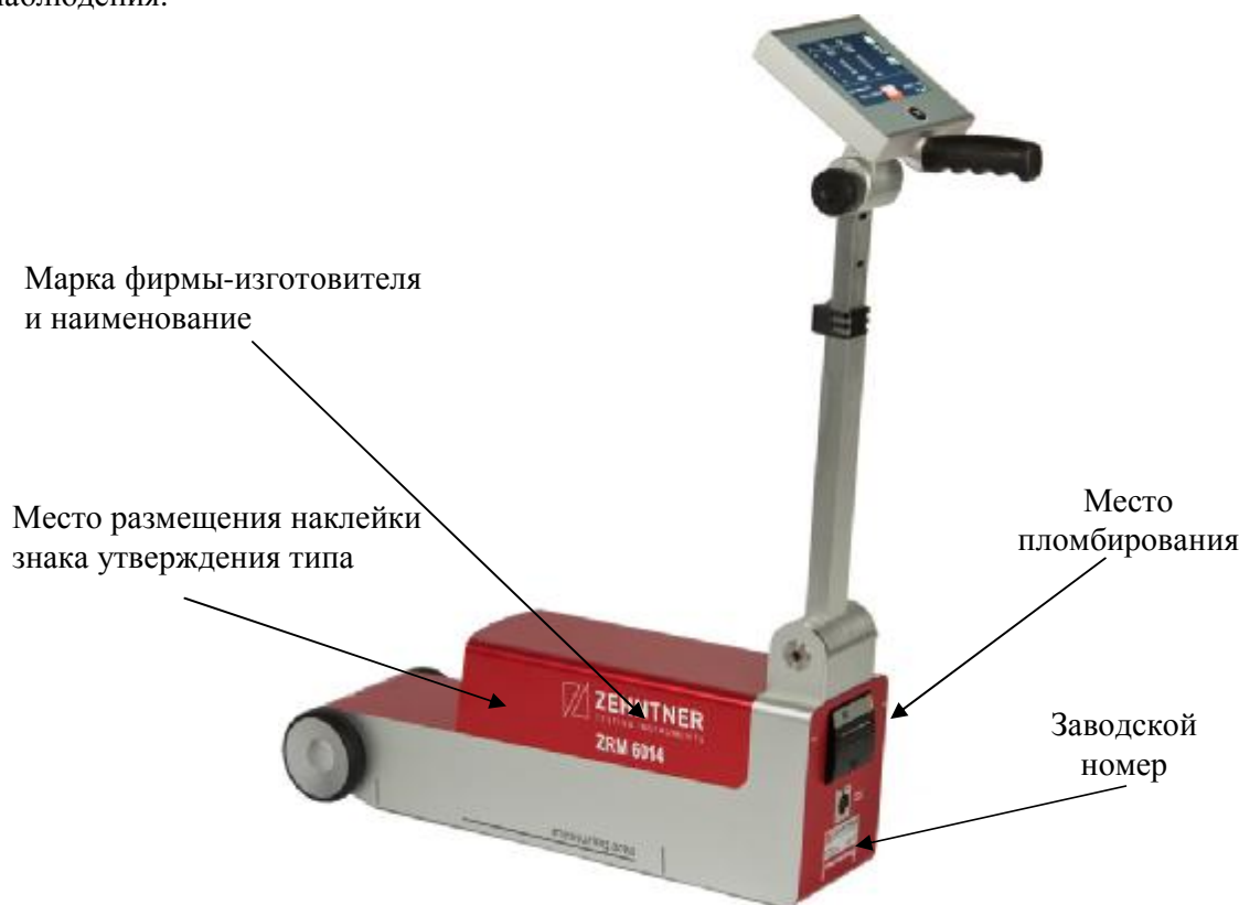
Рисунок 1 – Ретрорефлектометр ZRM 6014, обозначение мест маркировки и пломбирования

Ретрорефлектометры представляют собой переносной измерительно-индикаторный блок, состоящий из фотоприемного элемента (кремниевое фото диода), скорректированного под V(\lambda) , источника света типа А для измерения коэффициента световозвращения, источника света типа D_{65} для измерения коэффициента яркости (ZRM 6014, ZRM 6006) и электронных элементов, реализующих схему измерения сигнала в заданной геометрии освещения /наблюдения.