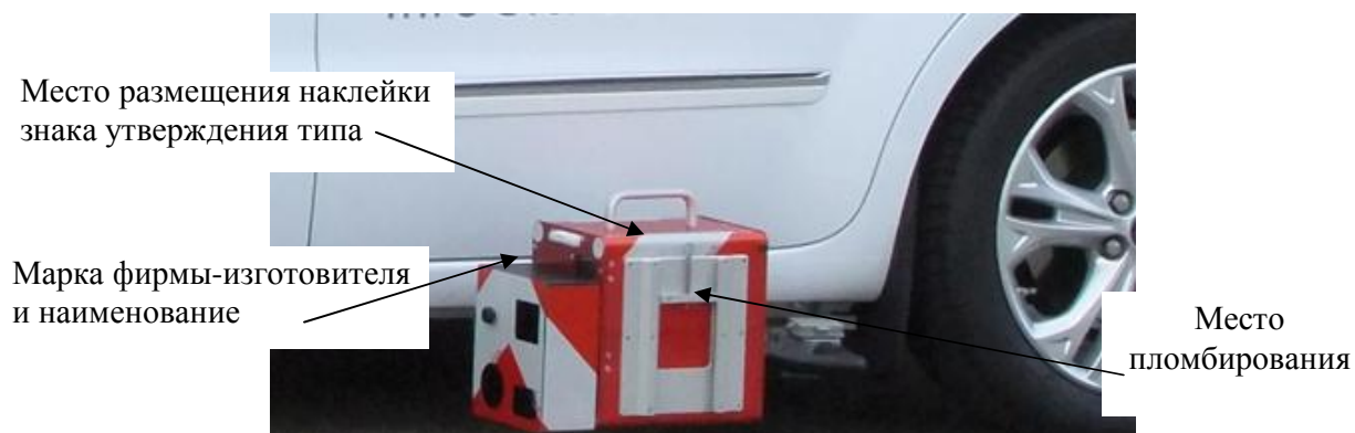
Рисунок 3 – Ретрорефлектометр ZDR 6020, обозначение мест маркировки и пломбирования