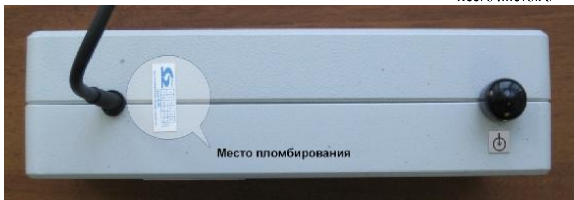
Рисунок 2 – Внешний вид преобразователя с указанием места пломбировки