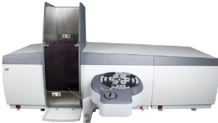
Рисунок 1 - Общий вид спектрометра атомно-абсорбционного А-2

Все операции, связанные с обработкой, регистрацией результатов измерений, передачей данных производятся автоматически. Предусмотрены ввод, редактирование и сохранение в памяти компьютера методик выполнения измерений массовой концентрации различных элементов.