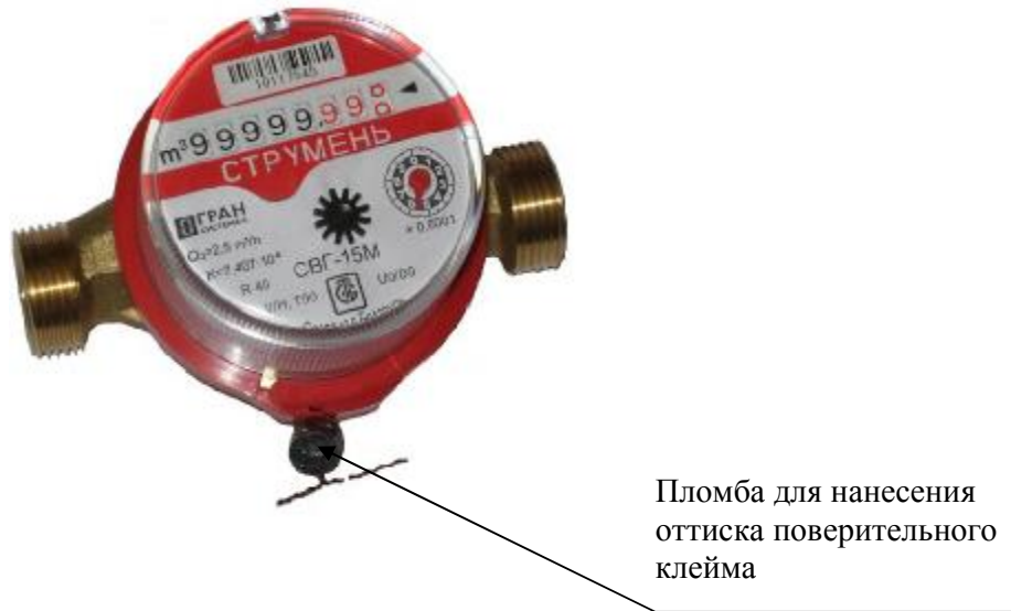
Рисунок 2 - Место пломбирования и клеймения счетчиков воды "СТРУМЕНЬ"