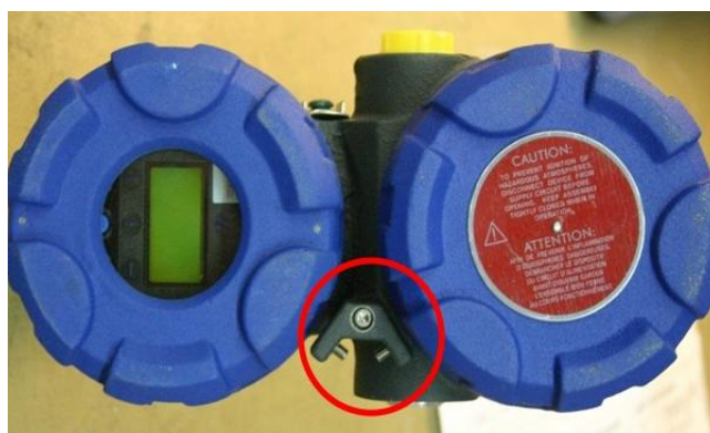
Рисунок 2. Место пломбирования уровнемеров.

Место пломбирования уровнемеров приведено на рисунке 2.