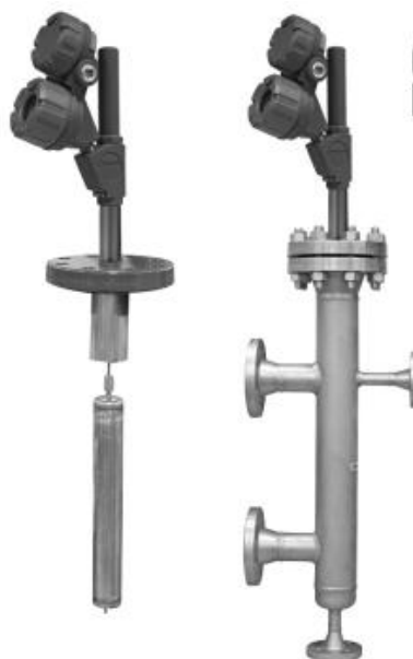
Рис. 1. Внешний вид уровнемеров