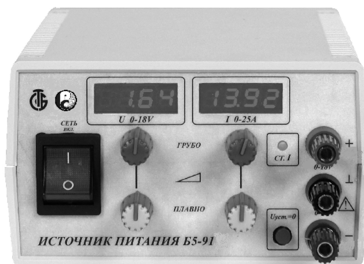
Рисунок 1. Внешний вид ИП.