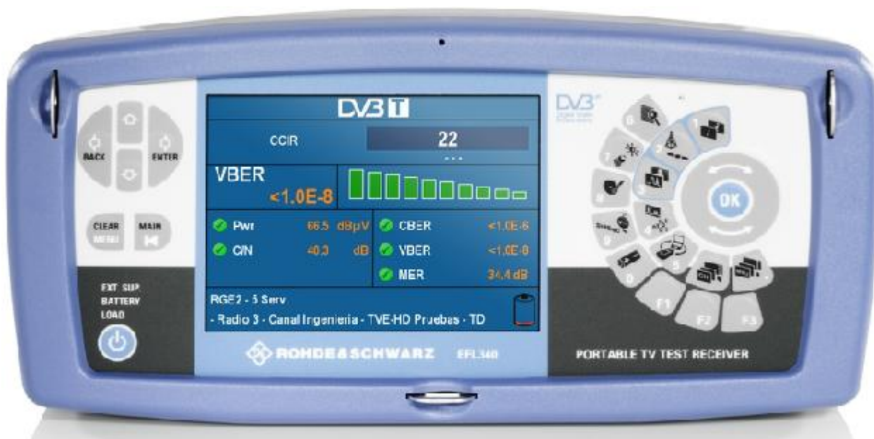
Рисунок 1 – Общий вид прибора