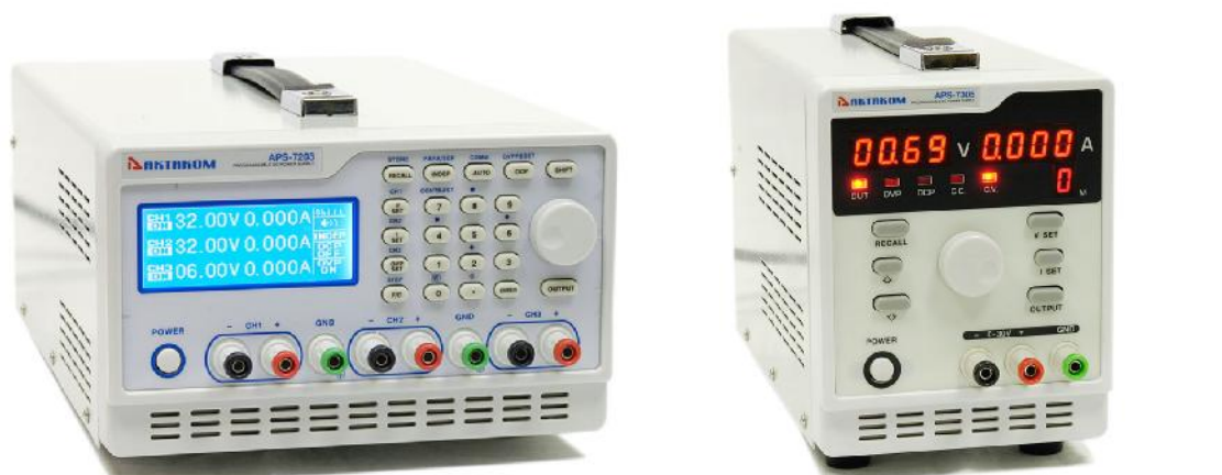
APS-7203, APS-7203L, APS-7205, APS-7205L