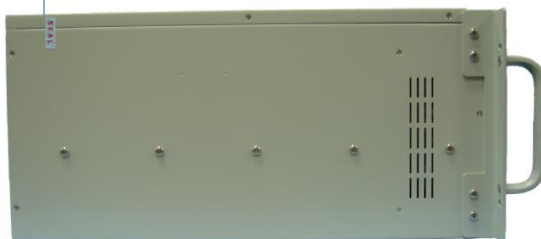
Рисунок 3. Внешний вид модуля КАЭМС-C1 с боковой стороны.