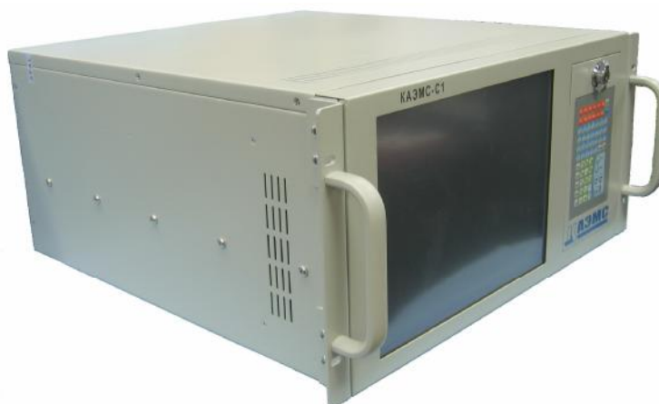
Рисунок 1. Внешний вид модуля КАЭМС-C1.

Внешний вид модуля КАЭМС-C1 со стороны задней панели представлен на рисунке 2.