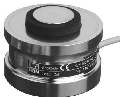
в) тензорезисторный датчик типа RTN