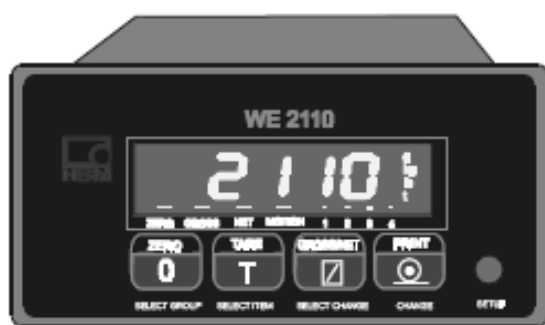
б) прибор весоизмерительный WE 2110