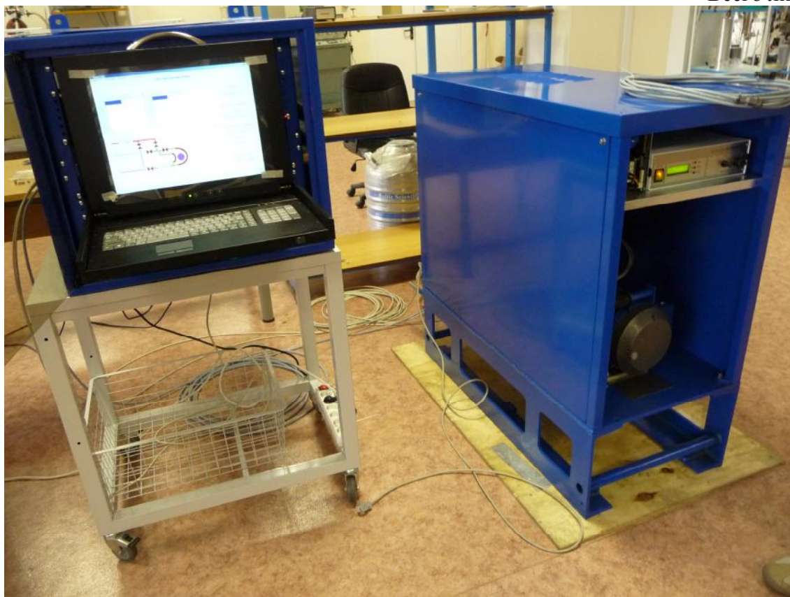
Рисунок 1 — Общий вид установки автоматизированной спектрометрической контроля теплоносителя первого контура АЭС СЖГ-1001

Все технические средства (ТС) установки должны быть опломбированы в соответствии с конструкторской документацией. Места пломбирования от несанкционированного доступа указаны на рисунке 2.