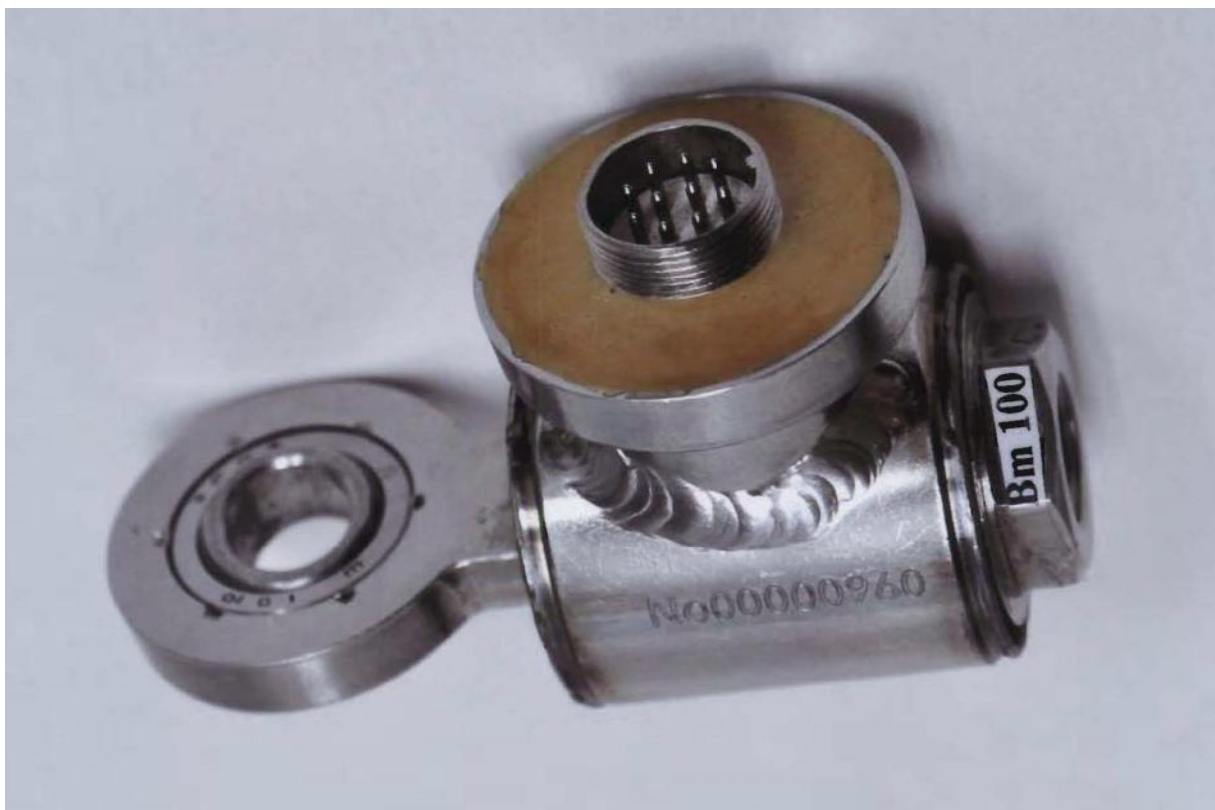
Рисунок 1 - Фотография общего вида датчика