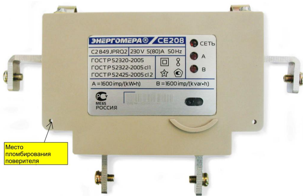
Рисунок 3 – Общий вид измерительного блока счетчика CE 208 C2