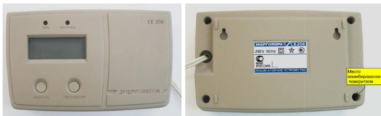
Рисунок 4 – Общий вид индикаторного устройства счетчика CE 208