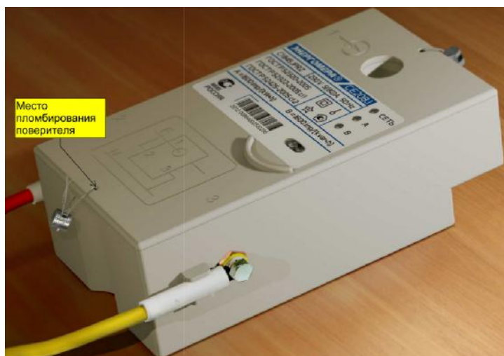
Рисунок 2 – Общий вид измерительного блока счетчика CE 208 C1