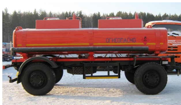
Рисунок 2 – Внешний вид с двумя отсеками