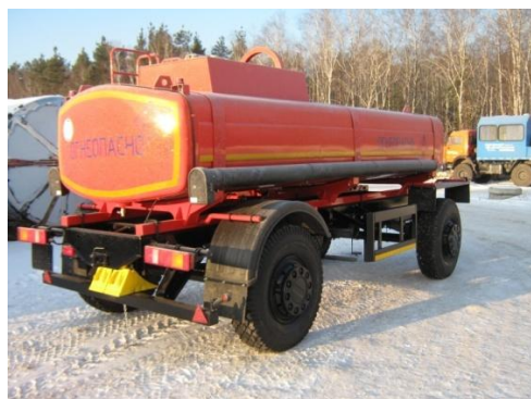
Рисунок 1 – Внешний вид с одним отсеком

Внешний вид ПЦ представлен на рисунке 1, 2. Место пломбирования обозначено на рисунке 3, 4 и 5.