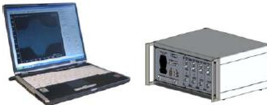
Рис. 3 Анализатор импульсов цифровой MIAS, исполнение С (в переносном варианте с внешним ноутбуком)