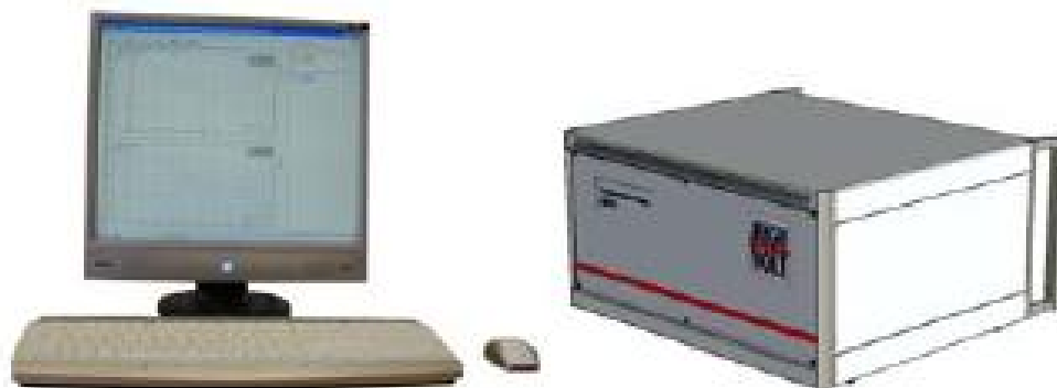
Рис. 2 Анализатор импульсов цифровой MIAS, исполнение С (с ЖК-дисплеем, клавиатурой и мышью)