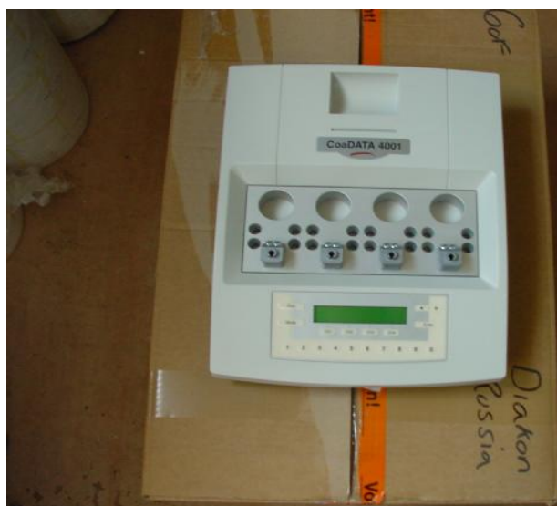
Рисунок 1 – Коагулометр полуавтоматический модели Helena CoaDATA 4001