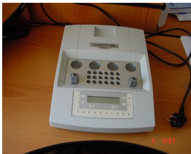
Рисунок 1 – Коагулометр полуавтоматический модели Helena CoaDATA 2001

Модель Helena CoaDATA 2001 имеет 2 измерительных канала, 4 позиции для реактивов и 18 позиций для кювет. Модель Helena CoaDATA 4001 имеет 4 измерительных канала, 4 позиции для реактивов и 16 позиций для кювет.