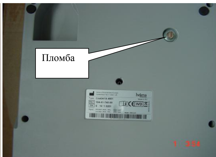
Рисунок 4 – Коагулометр полуавтоматический модели Helena CoaDATA 4001. Расположение пломбы.