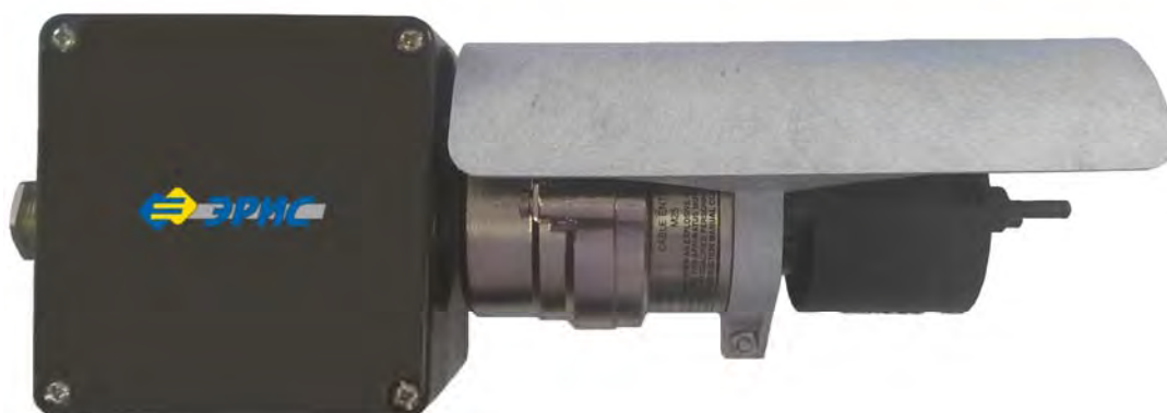
Рисунок 2 – Газоанализатор ЭРИС-ОПТИМА ПЛЮС, исполнение Б